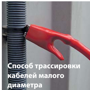
Способ трассировки кабелей малого диаметра